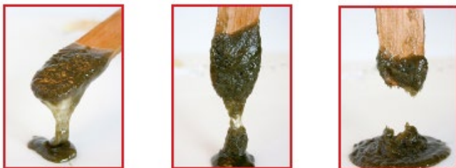
Esempio di addensamento con Z.FIX FIBRA NATURALE

In generale per quanto riguarda le applicazioni di più strati di Z.FIX CLEAR N tenere conto di quanto segue: